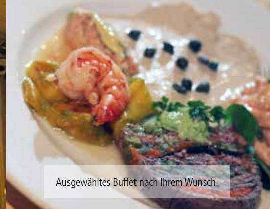
Ausgewähltes Buffet nach Ihrem Wunsch.