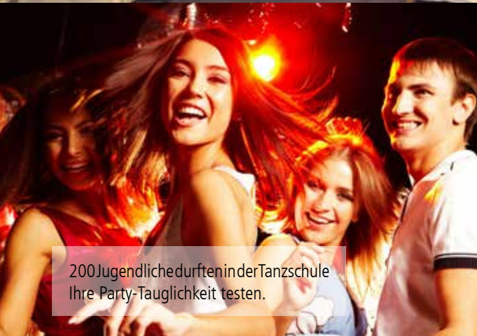
200 Jugendliche durften in der Tanzschule Ihre Party-Tauglichkeit testen.