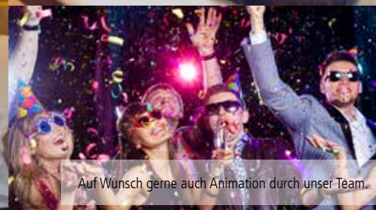
Auf Wunsch gerne auch Animation durch unser Team.