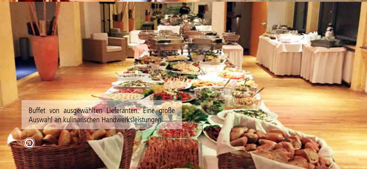
Buffet von ausgewählten Lieferanten. Eine große Auswahl an kulinarischen Handwerksleistungen.