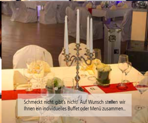
Schmeckt nicht gibt's nicht! Auf Wunsch stellen wir Ihnen ein individuelles Buffet oder Menü zusammen..