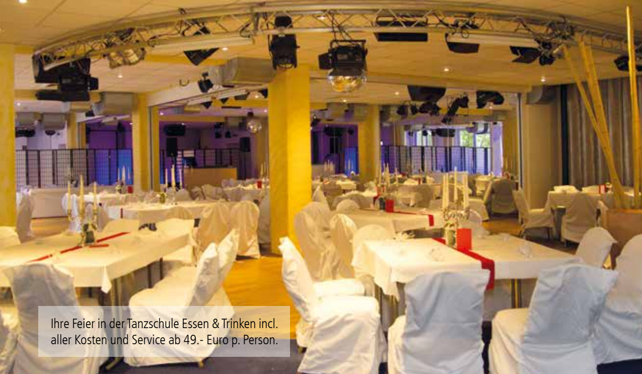
Ihre Feier in der Tanzschule Essen & Trinken incl. aller Kosten und Service ab 49,- Euro p. Person.